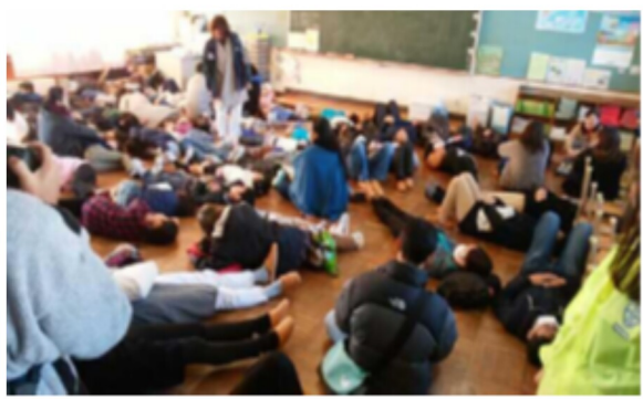
地域と小学校が連携して取り組んだ避難所生活体験の様子

【教育長】各学校に対して、参観日などの機会を捉えた防災に関する講演会や避難訓練の実施、児童生徒の地域での防災訓練の参加など、日ごろから保護者や地域との連携に努めるよう指導している。学校が実施する防災参観日