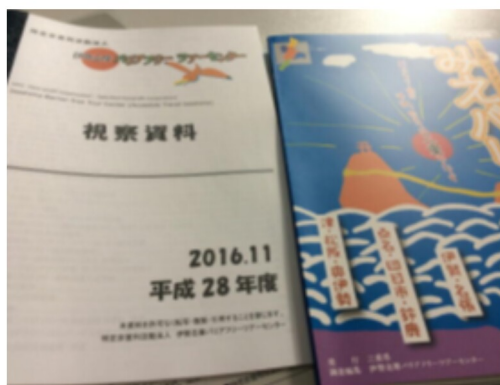
バリアフリーツアーセンターに学んだ資料